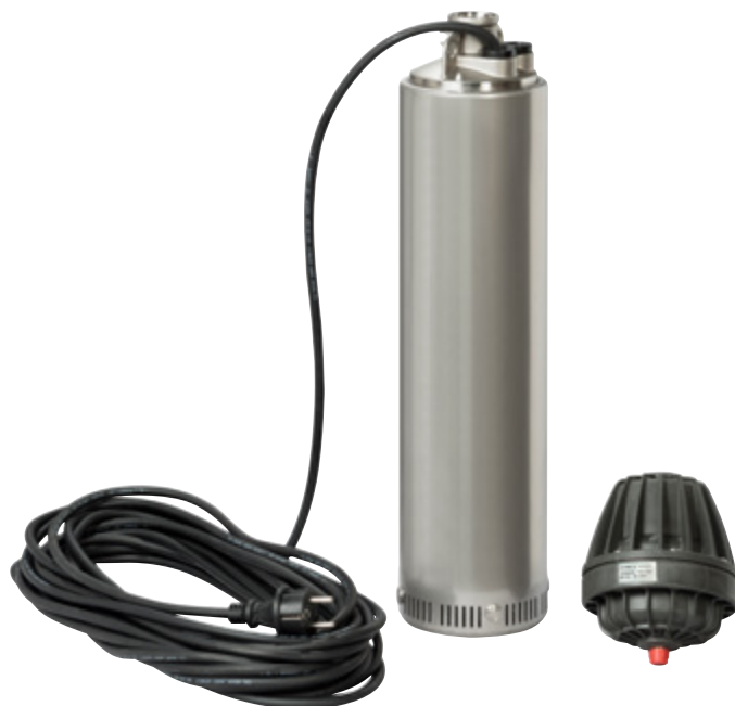
Ixo-Pro avec Kit-Press (en option)